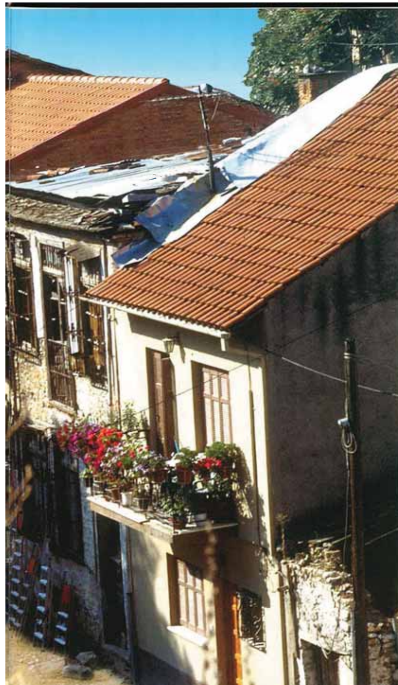
η οδός "εθνικής αντιστάσεως" (η παλαιά συνοικία "βαρελάδικα"), έξω από το κάστρο